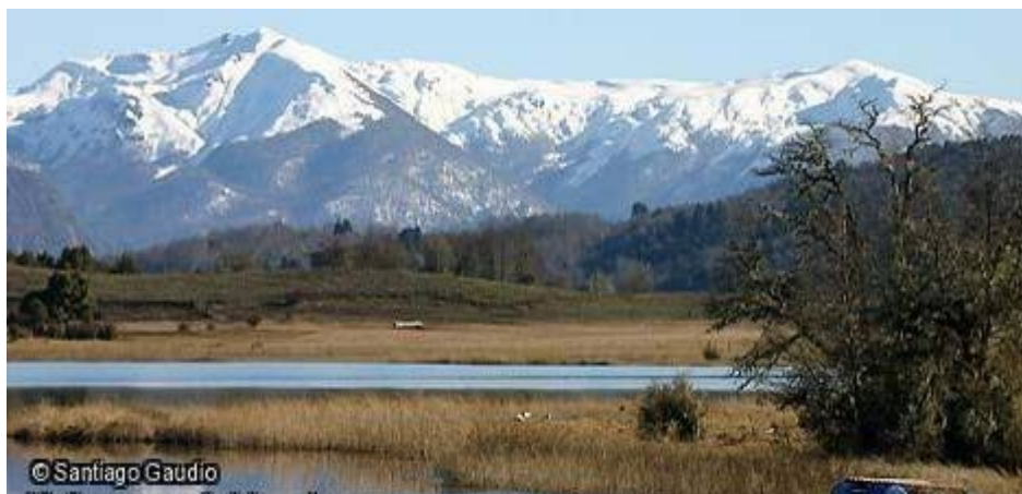
Imagen de los alrededores de San Martín de los Andes

Todos los días dedicaremos sus primeras horas para compartir salidas de campo. Los días jueves 25 y sábado 27 saldremos a pajarear en los alrededores entre las 7 y las 10 hs. El viernes 26 está previsto una salida más larga, de 7 a 14 hs, que incluye el almuerzo.